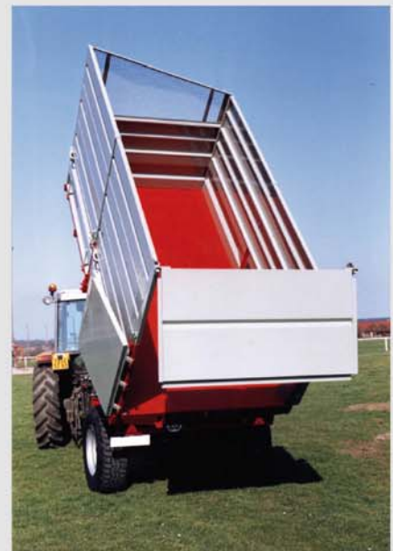
REMORQUE 8 TONNES AVEC REHAUSSES ET GRILLE ENSILAGE